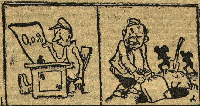
СЕЛЬСОВЕТ: Почему так плохо хлеб заготавливается? КУЛАК: Потому, что мной он в землю зарывается.