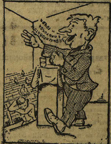
Рис. худ. Котенко.

тегорически настояла проводить собрание. В результате, перед лицом одного из состоящих shamee предправления Комбината Иволгина „зажаривая“ до-