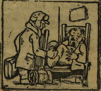
Рис. худ. Котенко.

Иван Иванович промчал раза три по-жорьевому и наконец проснулся