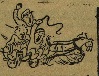
Рис. худ. Котенко.

не оберешься! А комсомол и парторганизация? — Э, да, что вы, не знаете Еськова? У него пшени только, тут тебе и смерть!